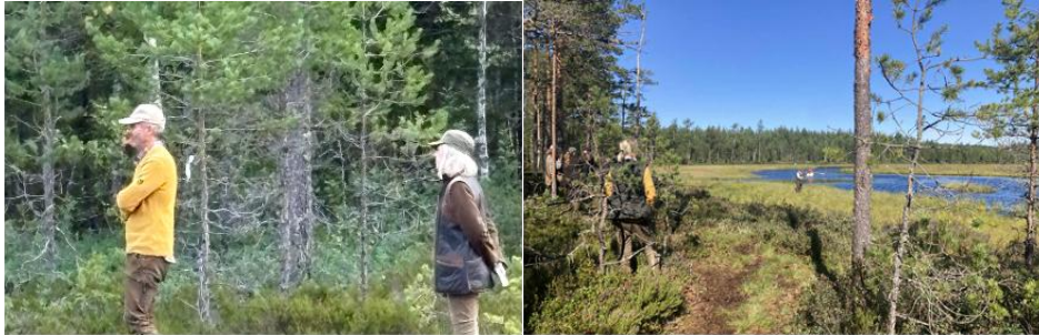
V:a Ämtervik 9 augusti