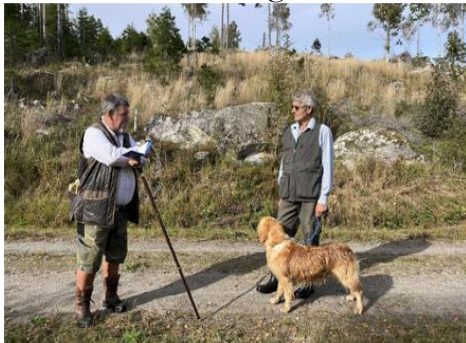
Arvika 19 augusti