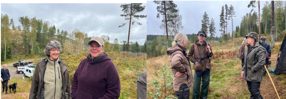
Arvika 20 augusti