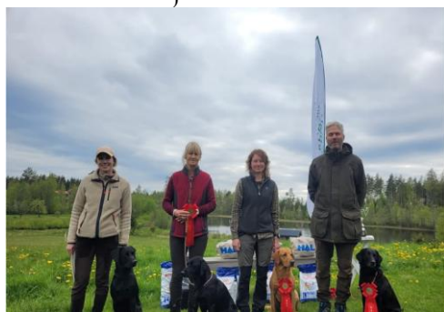
Ekl A 11 maj