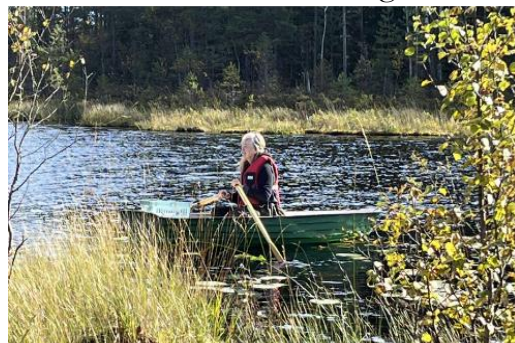
Arvika 19 augusti