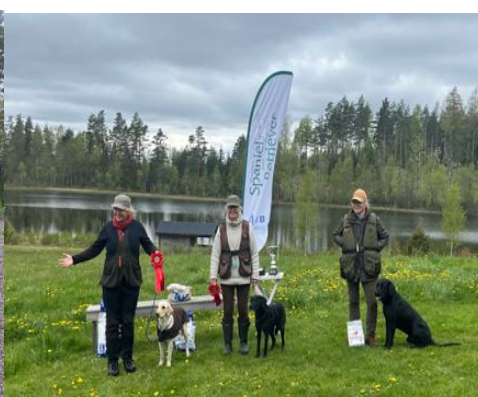
Ökl A 11 maj